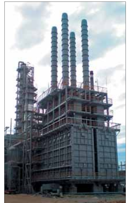
АГПЗ. Установка риформинга

ЗАО «ТЕПЛОМОНТАЖ» Г. ВОЛГОГРАД ПОД СИЛУ ВЫПОЛНИТЬ ЛЮБЫЕ ОБЪЕМЫ ПО СВОЕЙ СПЕЦИФИКЕ, Т.К. РАСПОЛАГАЕТ ВСЕМ НЕОБХОДИМЫМ ДЛЯ ЭТОГО.