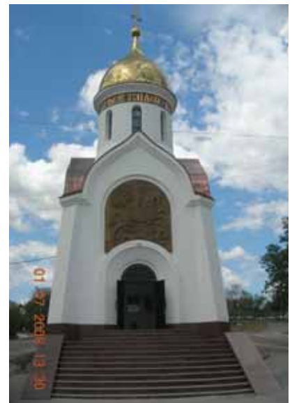
Часовня Во Имя Святого Георгия Победоносца

ких выставочных залов и административных помещений в зданиях музея по пр.Ленина и по ул.Чуйкова.