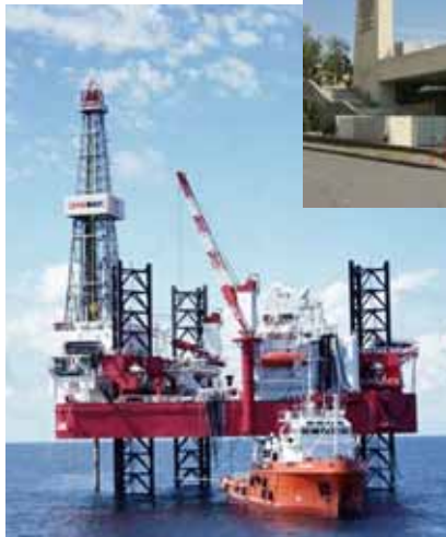
ООО ЛУКОЙЛ-Нижневолжскнефть Ледостойкая платформа АСТРА

ли ряд небольших экспертиз и провели многочисленные консультации в области эксплуатации строительных конструкций, оснований и фундаментов, технических устройств.