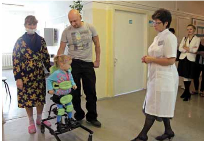
«Гоша Куценко и Вероника Расторгуева в Областной детской клинической больнице»

В 2012 году из трех с половиной тысяч претендентов со всей страны генеральный директор компании вошла в «ТОП 250 российских руководителей».