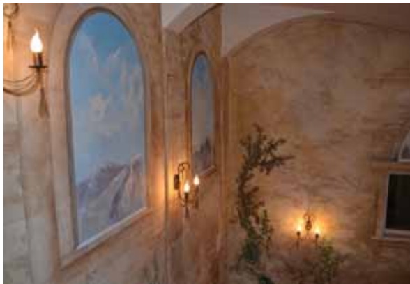
Роспись стен. 3D живопись. Фрески. Декор интерьера