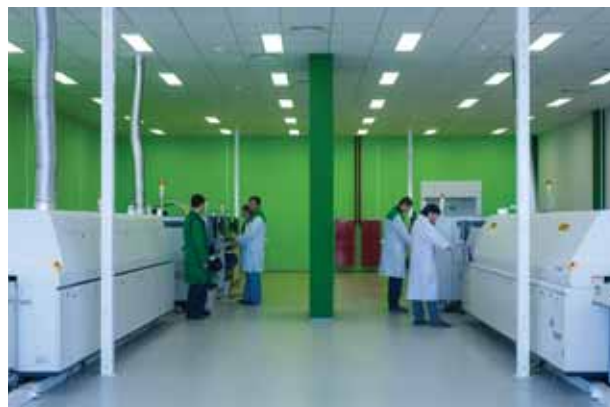
Производственные помещения завода оборудованы светодиодным освещением