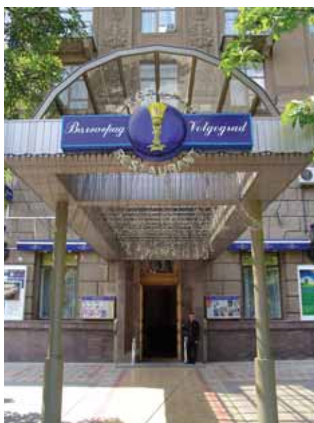
Ресторан «Волгоград», ул. Мира, 12

ГК «Столия» 400074, г. Волгоград, ул. Р.-Крестьянская, 22, 3 этаж Тел. (8442) 55 11 44 e-mail: administrator@stoliya.ru сайт: www.stoliya.ru