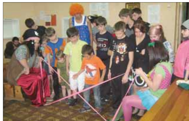
Праздник ко Дню знаний в «Детском Православном Приюте «Дом Милосердия»

Также организация осуществляла помощь в капитальном и текущем ремонте Волгоградскому государственному медицинскому университету, Волгоградскому филиалу Российской академии народного хозяйства и государственной службы, Волгоградскому областному физкультурному диспансеру, Волгоградскому областному клиническому хоспису, Волгоградскому областному суду и многим другим.