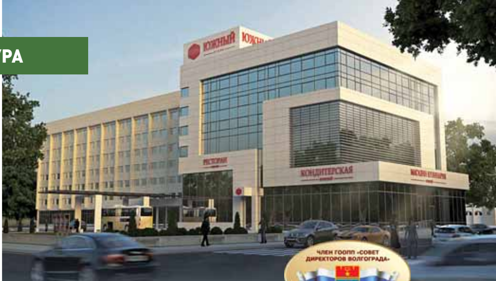
Отель «Южный», ул. Рабоче-Крестьянская, 18

Группа компаний «Столия» давно уже стала узнаваемым брендом в Волгограде, каждый горожанин хоть раз бывал в одном из ее предприятий. Начав свою историю в 1991 году с оптовой и розничной торговли, ресторанный бизнес, компания динамично развивалась все эти годы, открывая новые рестораны, кулинарии, реконструируя отели.