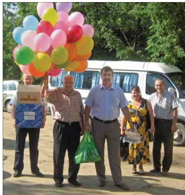
На празднике, посвященном Дню защите детей в «Волгоградском специализированном доме ребенка»

Предприятие имеет большой опыт работы с бюджетными организациями нашего региона. На протяжении длительного времени ООО «Царицын Стройсервис» сотрудничает со многими организациями, такими как комитет по строительству го-