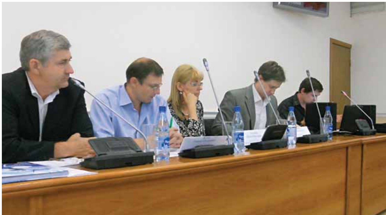
Представители СМИ, партнеры ГОПП «Совет директоров Волгограда»

22 мая прошлого года состоялось расширенное заседание Президиума «Совета директоров Волгограда» по очень важному и актуальному вопросу – информационному взаимодействию. На мероприятии был презентован новый сайт Совета директоров Волгограда и подписано Соглашение об информационном сотрудничестве с рядом электронных деловых СМИ.