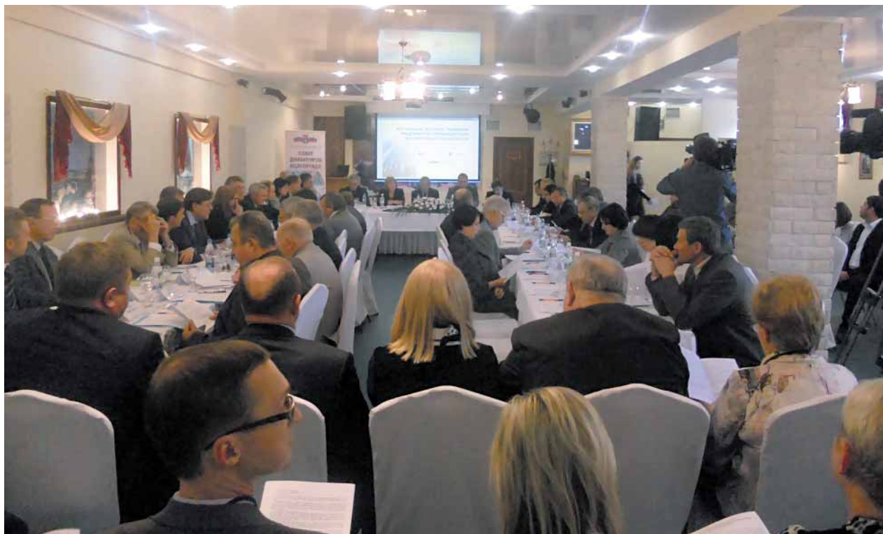
Подпись к фото