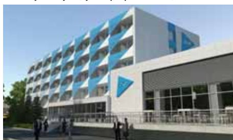
Отель «Старт», ул. Грамши, 4