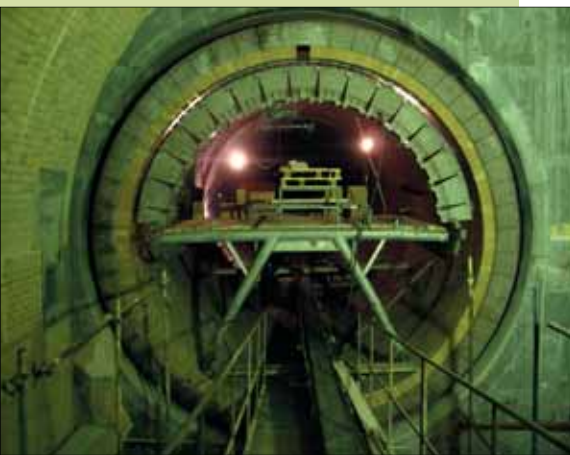
ОАО Мордовцемент. Головка печи