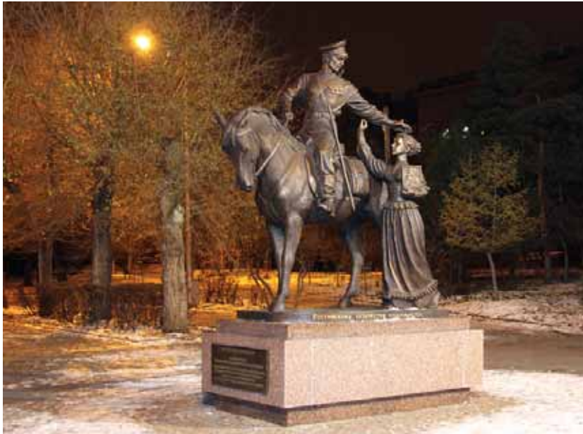
Скульптурная композиция посвящённая историческому подвигу Российского казачества «Прощание казачки»

ООО «ПроектСтрой XXI век» был основан в 1994 году. Наша организация состоит в саморегулируемой организации, основанной на членстве лиц, осуществляющих строительство НЕКОМЕРЧЕСКОЕ ПАРТНЕРСТВО «Строительный комплекс Волгоградской области».