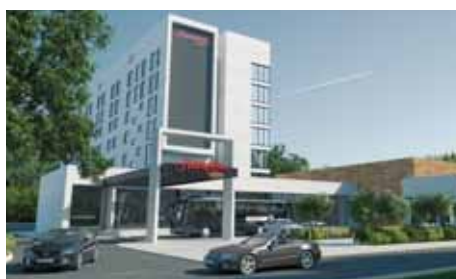
Отель «Hampton by Hilton Volgograd Profsoyuznaya», ул. Профсоюзная, 13