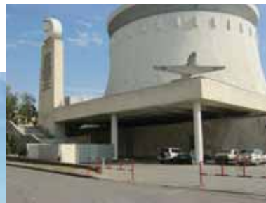
Панорама Сталинградской Битвы

сить качество проектных решений, ликвидировать аварийные ситуации, восстановить работоспособность конструкций и повысить эксплуатационную надежность зданий и сооружений.