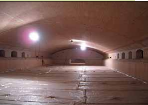
Московская область, г. Раменское. Ванна стекольной печи

Направлением специфики СМУ «Тепломонтаж» является строительство и ремонт агрегатов огневой теплотехники, а именно: строительство и ремонт промышленных печей, включая футеровку и монтаж/конструкций, строительство и ремонт кирпичных, ж/бетонных и металлических дымовых труб высотой до 120 м на металлургических, химических, нефтехимических, нефтегазоперерабатывающих производствах и других предприятиях народного хозяйства г. Волгограда и всей страны.