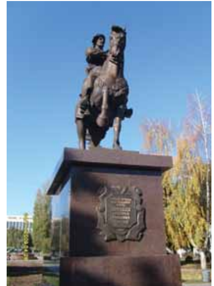
Скульптурная композиция, посвященная первому воеводе Царицына князю Засекину Г.О.

ООО «ПроектСтрой XXI век» несколько лет сотрудничает с «Музеем изобразительных искусств им.Машкова». За это время был произведен ремонт несколь-